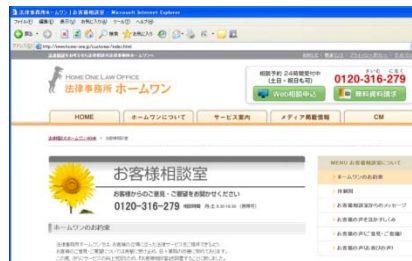
お客様相談室の設置(2009年8月5日設置)

この中で掲げた「説明責任の徹底」、「お客様の意向尊重」を実現するべく、8月に「お客様相談室」を設置いたしました。